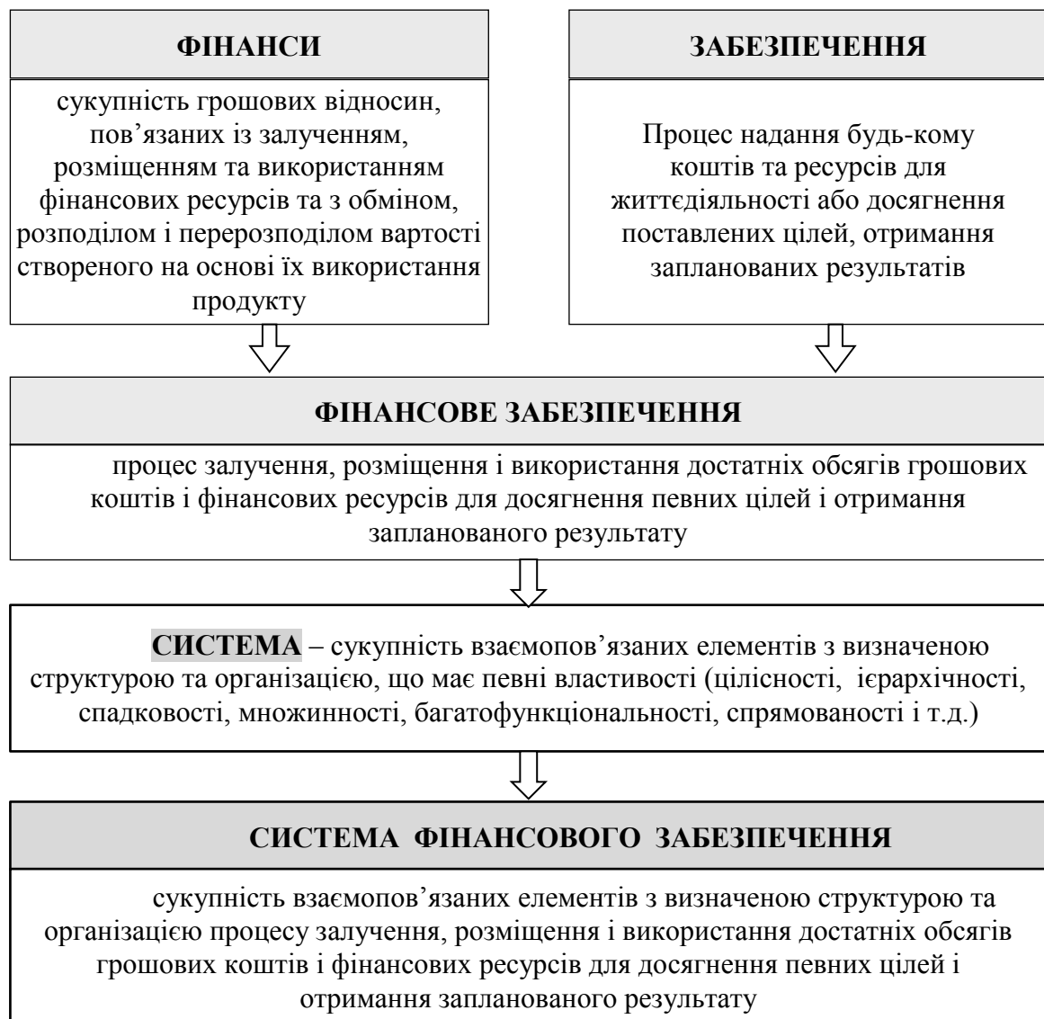
Рис. 1. Схема визначення сутності поняття «фінансове забезпечення» і «система фінансового забезпечення»

Не зрозуміло з робіт [18; 19], по-перше, чому страхування і фінансовий ринок є окремими блоками; по-друге, фінансовий ринок може бути національним, а може бути міжнародним, це у схемі не деталізується, і блоки також є відокремленими, а не такими, що перетинаються; по-третє, у фінансовій системі об'єднано як види фінансової діяльності, наприклад, страхування, так і суб'єкти ринку; в четвертих, недоліком даного підходу вважаю не врахування провідної інституційної ланки фінансового ринку, а саме