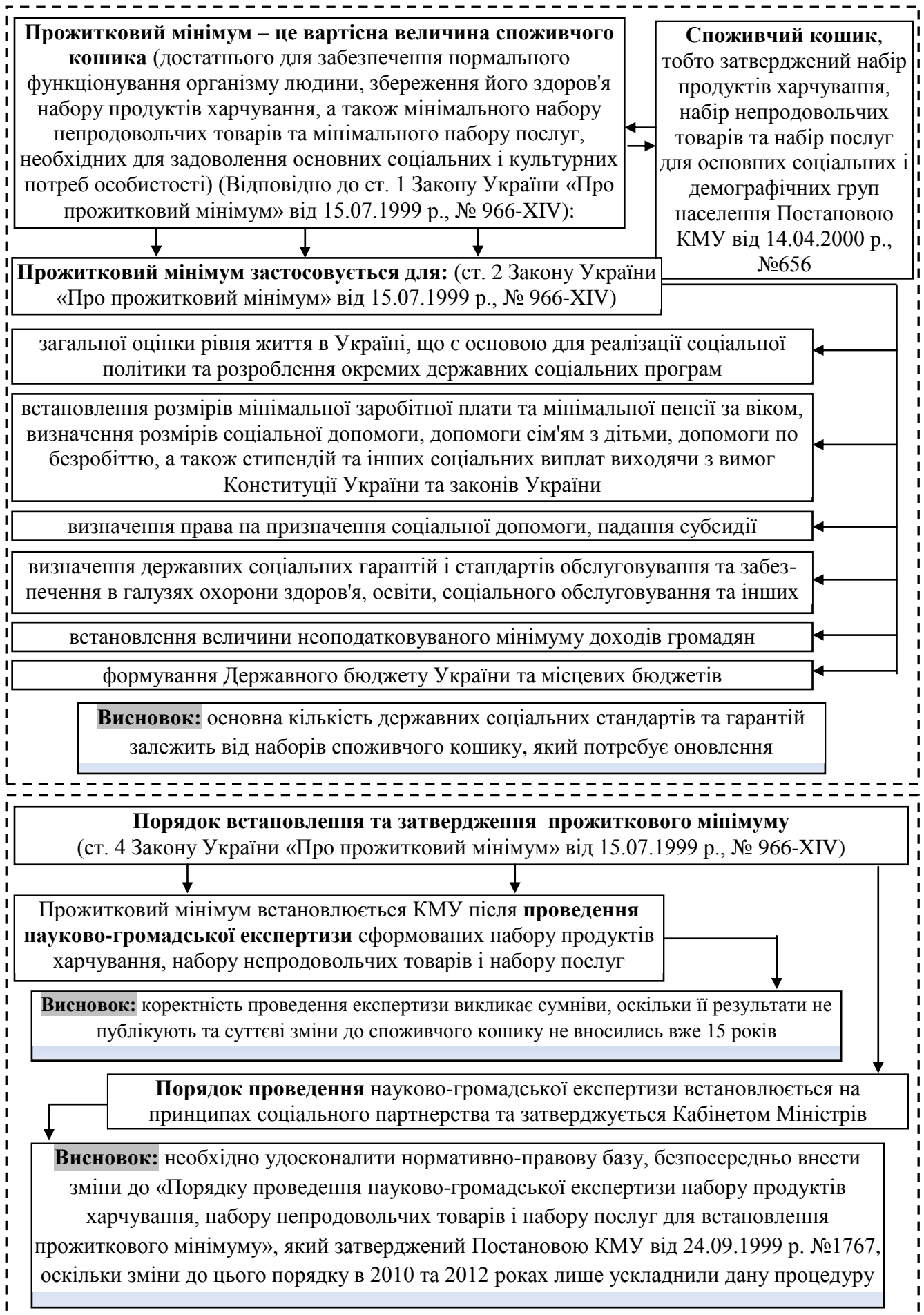
Рис. 1.1. Обґрунтування необхідності перегляду споживчого кошика