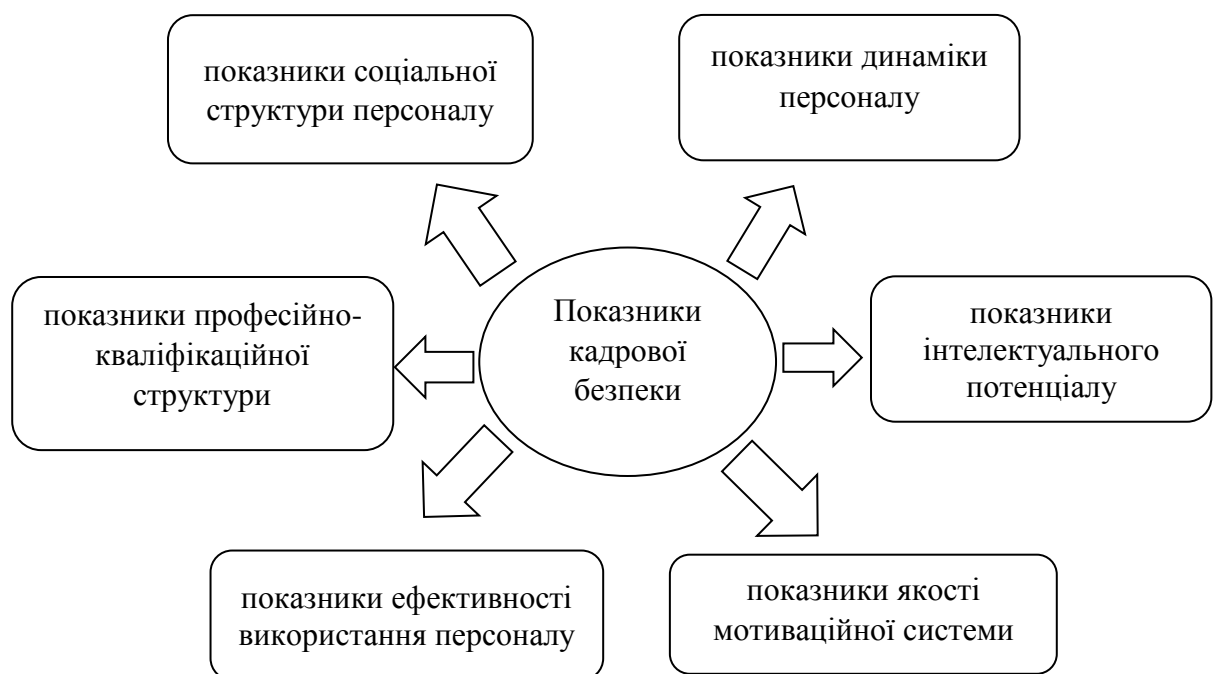
Рис. 2. Групи показників кадрової безпеки організації

Зважаючи на те, що в якості досліджуваного підприємства виступає оцінювальна компанія, то необхідно проаналізувати нормативно-правове забезпечення кадрової безпеки оцінювальної компанії. Основним фактором довіри до процесу оцінки є впевненість тих, хто покладається на оцінку, що результати оцінки надаються оцінювачами, які мають відповідний досвід, знання та вміння, які діють на професійній основі і застосовують своє судження, вільне від будь-якого впливу або пристрасті. Групи показників, які визначають кадрову безпеку організації, наведені на рис. 2.