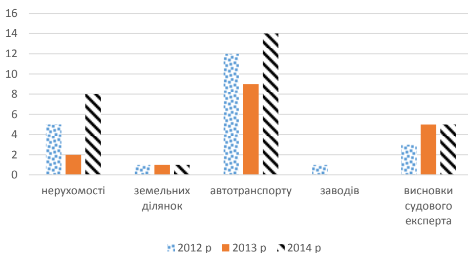
Рис. 5. Динаміка кількості відкритих кримінальних справ, в яких фігурують результати оцінки майна ТОВ «Сател Груп» за об'єктами

Динаміка кількості відкритих кримінальних справ, в яких фігурують результати оцінки майна ТОВ «Сател Груп» за об'єктами, надана на рис. 5.