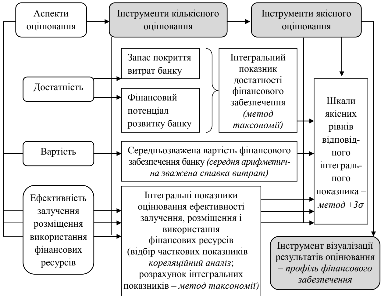
Рис. 2. Схема реалізації методичного підходу до оцінювання фінансового забезпечення технологій управління фінансовою діяльністю банку

01.04.2015), проте ефективність використання фінансових ресурсів була нижче від середнього рівня.