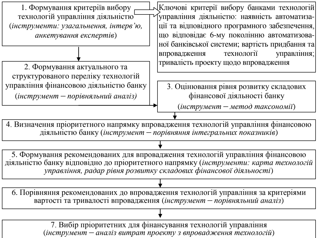
Рис. 3. Етапи й інструменти реалізації методичного підходу до вибору пріоритетного напрямку фінансування технологій управління фінансовою діяльністю банку

Розроблений у роботі методичний підхід до вибору пріоритетного напрямку фінансування технологій управління фінансовою діяльністю банку дав змогу обґрунтувати, що: для ПАТ «Укресімбанк» пріоритетним є фінансування технологій управління доходами; для ПАТ КБ «Приватбанк» та ПАТ «Райффайзен банк Аваль» – технології управління розміщенням фінансових ресурсів, зокрема ProFIX/TELEBANK; Oracle's Credit-to-Cash; Oracle's Asset Lifecycle Management; ПАТ «Сбербанк» доцільним є фінансування технологій управління рентабельністю та використанням фінансових ресурсів.