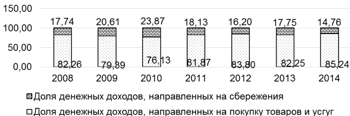
Рис. 1. Изменение структуры распределения денежных доходов физических лиц Украины за период с 2008 по 2014 год

Из рис. 1 видно, что в течение 2008 – 2010 гг. наблюдалась тенденция убывания доли денежных доходов, направленных на покупку товаров и услуг, что позитивно влияло на объемы депозиты физических лиц. А в 2011 – 2014 годах произошло увеличение доли денежных доходов, направленных на покупку товаров и услуг.