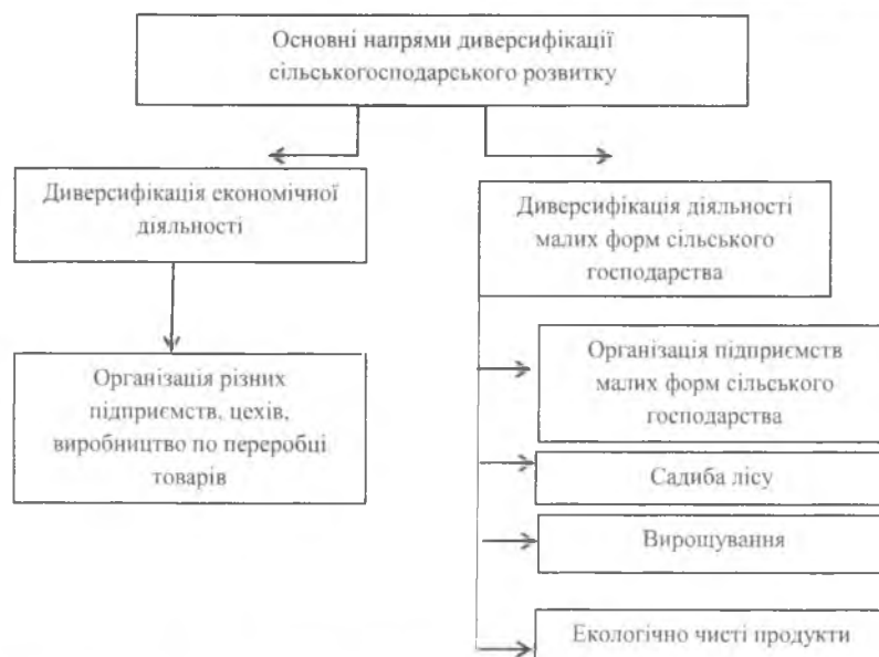
Рис. 2. Основні напрями диверсифікації сільськогосподарського виробництва

ка у всіх галузях економіки, в 2000 році — 13,8%, в 2007 році — 7,6% [10].