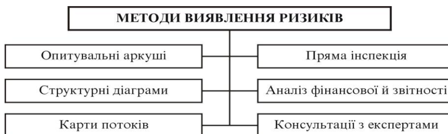
Рис. 1.1. Методи виявлення ризиків, що використовуються в діяльності вітчизняних підприємств

Методи виявлення ризиків подані на рис. 1.1.