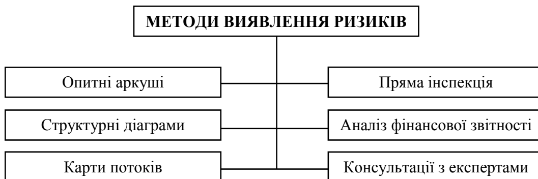
Рис. 1.1. Методи виявлення ризиків, що використовують у діяльності вітчизняних підприємств

Методи виявлення ризиків подано на рис. 1.1.