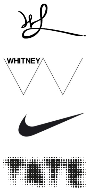
Рис. 1. Фирменные знаки и логотипы, передающие впечатления: женственный, легкий, динамичный, мягкий

Именно благодаря наличию у человека механизмов синестезии, ассоциации и аналогии, графический элемент, воспринимаемый органами зрения, может вызывать впечатления, соответствующие другим органам чувств. Именно благодаря этому образ предмета, который непосредственно не воздействует в данный момент на органы чувств человека, можно передать этому человеку с помощью средств визуальных коммуникаций. В этом случае визуальные ощущения передают информацию и о тех свойствах предмета, которые соответствуют другим видам ощущений – слуховым, зрительным, осязательным, обонятельным, вкусовым (рис. 1).