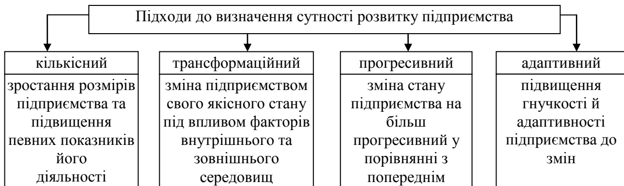
Рис. 1. Підходи до визначення сутності розвитку підприємства

Узагальнюючи матеріали, представлені в табл. 1, можна виділити чотири основні підходи до визначення сутності розвитку підприємства як економічної категорії (рис. 1).