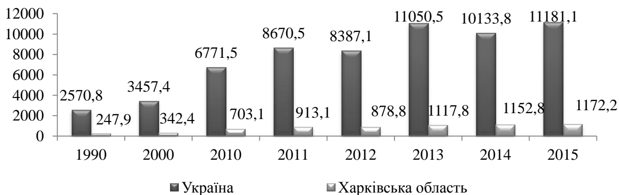
Рис. 1 Динаміка обсягів виробництва соняшнику в Україні і Харківській області за період 1990-2015 рр., тис. т

Інтеграція України до світових сільськогосподарських ринків забезпечила доступ вітчизняних товаровиробників до сучасних технологій вирощування ряду основних культур. Це позначилося зростаннями продуктивності, збільшенням урожайності культур, зокрема соняшника.