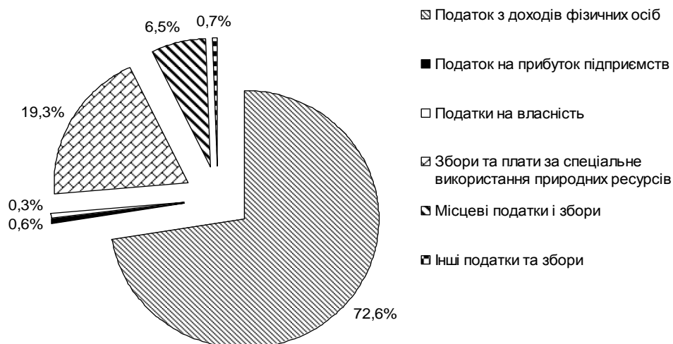
Рис. 2. Структура податкових надходжень зведеного бюджету Харківського району у 2011 р.

%. За 2009 – 2011 рр. у структурі податкових надходжень найбільшу питому вагу має податок з доходів фізичних осіб, а найменшу – податки на власність (рис. 2).