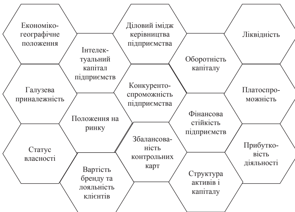
Рис. 2. Основні складові інвестиційної привабливості підприємства

Особливо варто зазначити, що інвестування є визначальним фактором економічного розвитку будь-якої країни та забезпечення конкурентоспроможності та успішної діяльності окремого підприємства. Для отримання інвестиційних ресурсів підприємство повинно відповідати ряду характеристик, тобто бути інвестиційно привабливим.