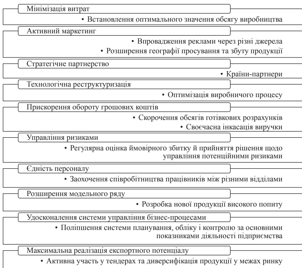
Рис. 4. Напрямки підвищення міжнародної інвестиційної привабливості підприємства

У практичному використанні метод рейтингової оцінки інвестиційної привабливості підприємств сприяє збільшенню кількості потенційних