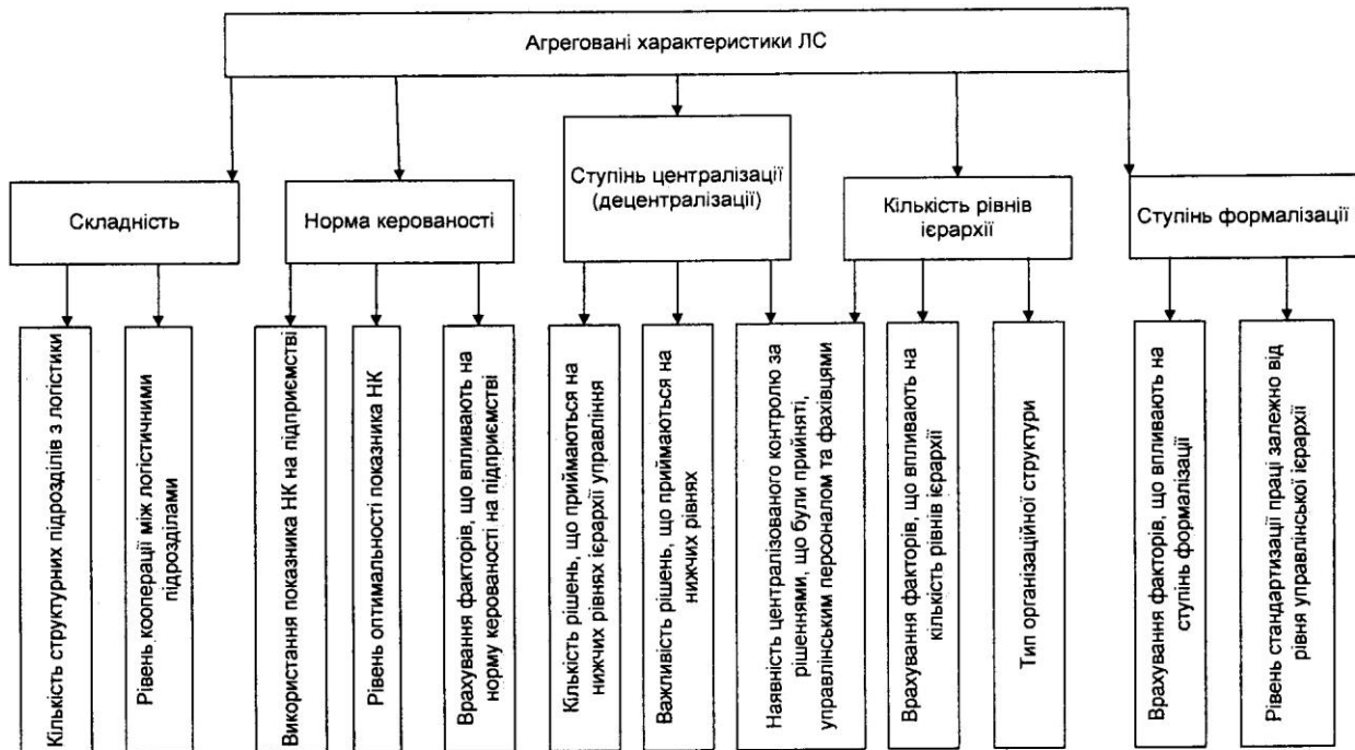
Рис. 2. Агреговані характеристики ЛС та чинники, що їх визначають