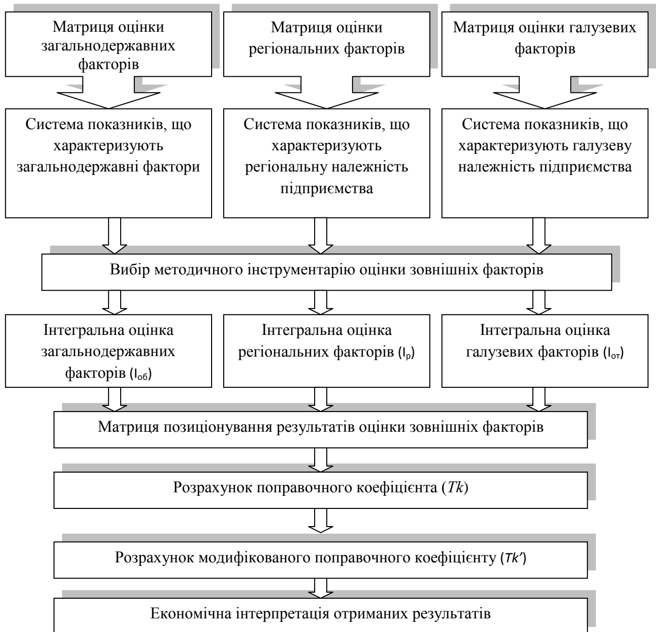
Рис. 2. Концептуальна модель оцінки рівня впливу зовнішніх факторів на величину ІВП

систему ключових зовнішніх факторів і провести їх кількісну оцінку. Необхідність проведення кількісної оцінки рівня впливу факторів зовнішнього середовища на величину ІВП пов'язано з виявленням потенційних погроз і нових можливостей для розвитку підприємства. Концептуальна модель оцінки рівня впливу факторів зовнішнього середовища на величину ІВП, представлена на рис. 2.