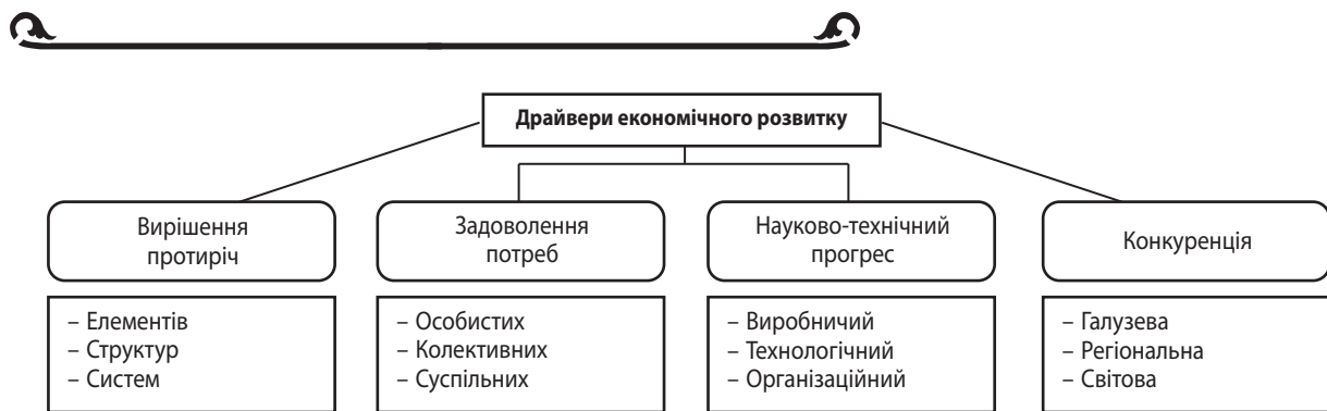
Рис. 2. Основні завдання рушійних сил економічного розвитку