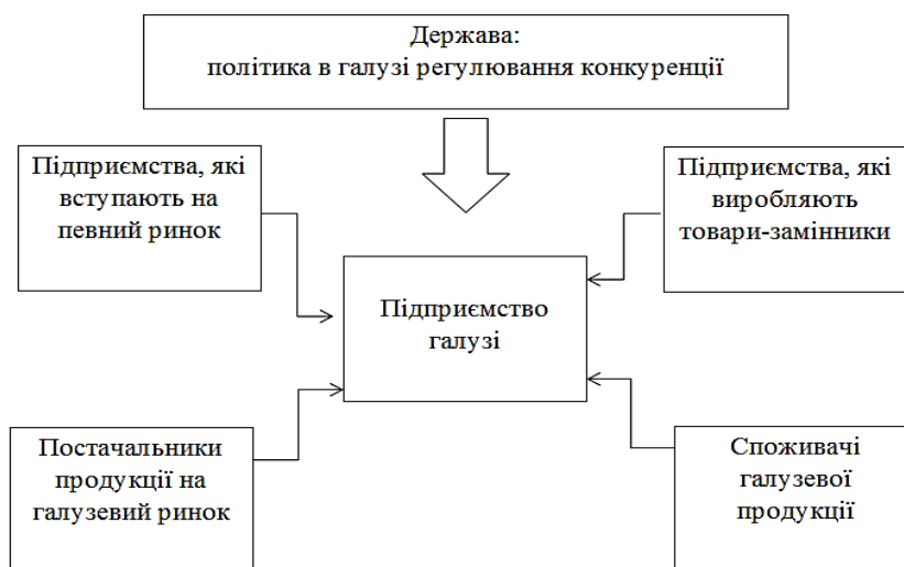
Рис. 2. Структура конкурентного середовища підприємства [6, с. 18]