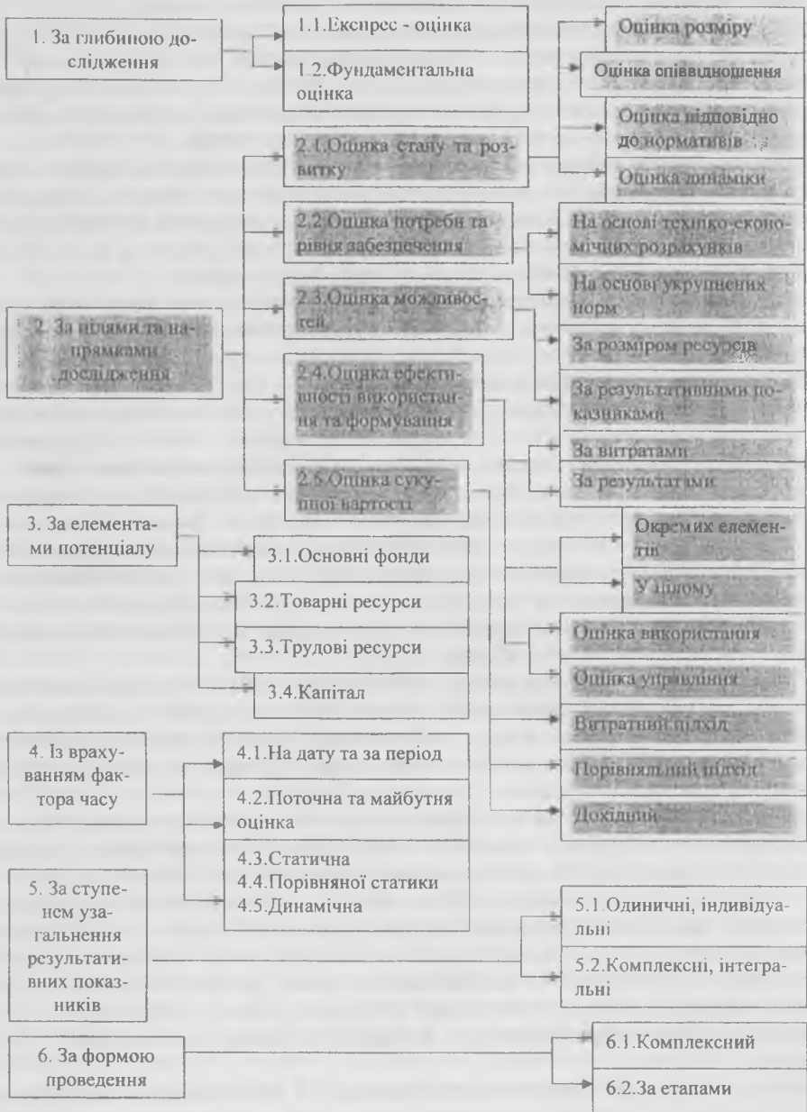
Рис. 1. Класифікація методичних підходів щодо оцінки ресурсного потенціалу підприємства торгівлі