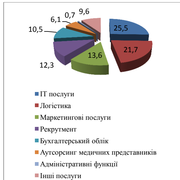
Рис. 1. Розподіл послуг аутсорсингу в Україні

У сфері логістики межі аутсорсингу можуть бути обмеженими тільки закупівлею деяких логістичних функцій, або можуть охоплювати управління цілими ланцюгами постачання.