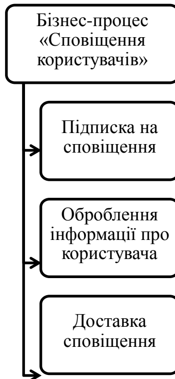
Рис.2. Діаграма «Дерево функцій» для процесу сповіщення клієнтів

Характеристика бізнес-процесу «Доставка сповіщень користувачам» представлена в табл. 3.