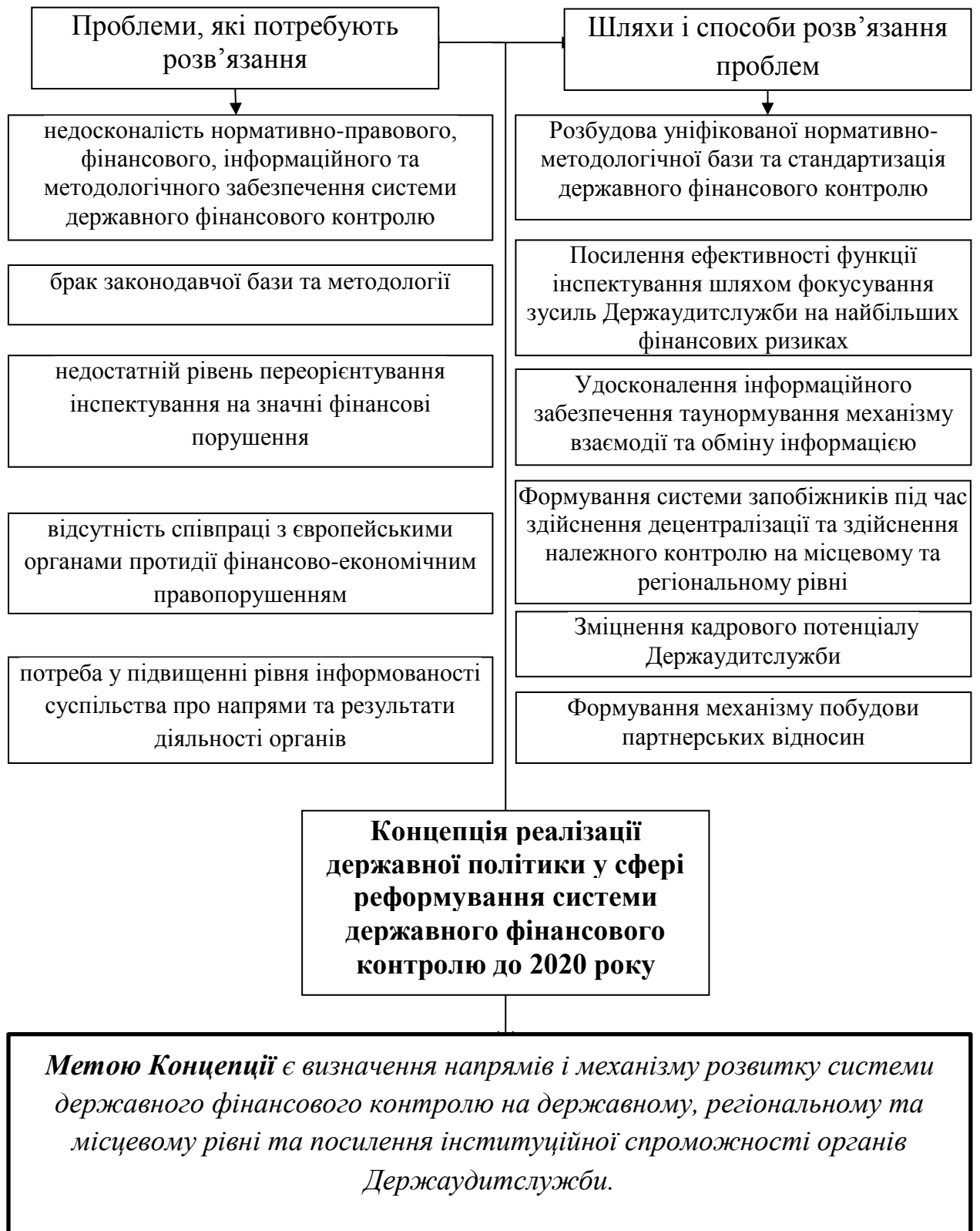
Рис. 2. Проблеми реформування ДФК та шляхи їх розв'язання згідно з Концепцією