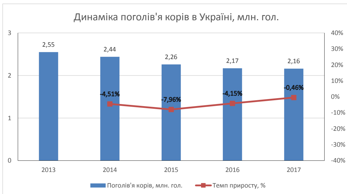
Рис.1 Динаміка поголів'я корів в Україні за 2013-2017 рр.

Вітчизняні магазини представляють широкий асортимент молочної продукції. Виробники змагаються за увагу покупців шляхом виведення на ринок продукції з новими смаковими та споживчими якостями. Ціни на молоко та молочні продукти демонструють динаміку зростання. Так, згідно сайту Державної служби статистики України, у 2017 року середня закупочна ціна на молоко у фермерів зросла на 47,1% у порівнянні з 2016 роком. Помітне сповільнення темпів скорочення поголів'я корів було спричинено збільшенням доходів агропідприємств у галузі виробництва молока. Така ситуація свідчить про поступове подолання кризи у галузі. Дані щодо динаміки поголів'я корів в Україні протягом 2013-2017 років представлені на рис. 1.