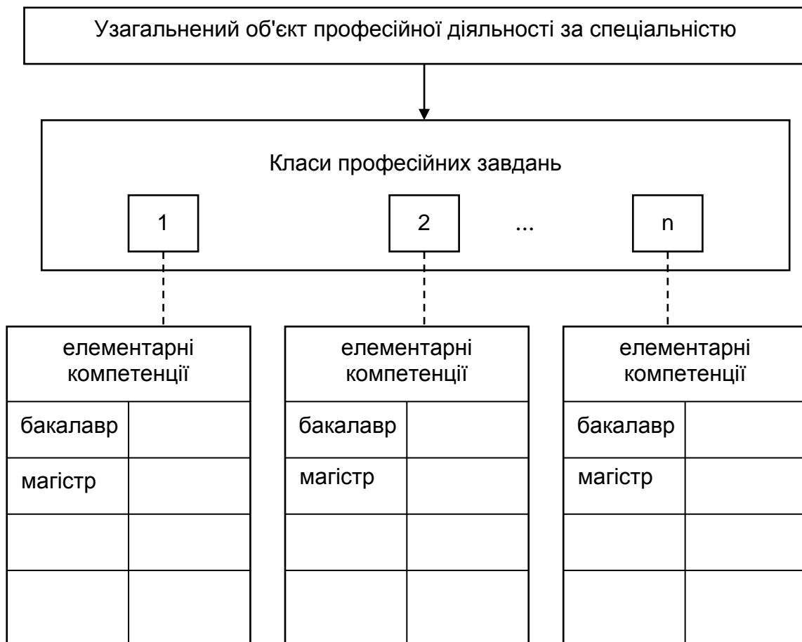
Рис. Г.3. Структурна схема формування елементарних компетенцій