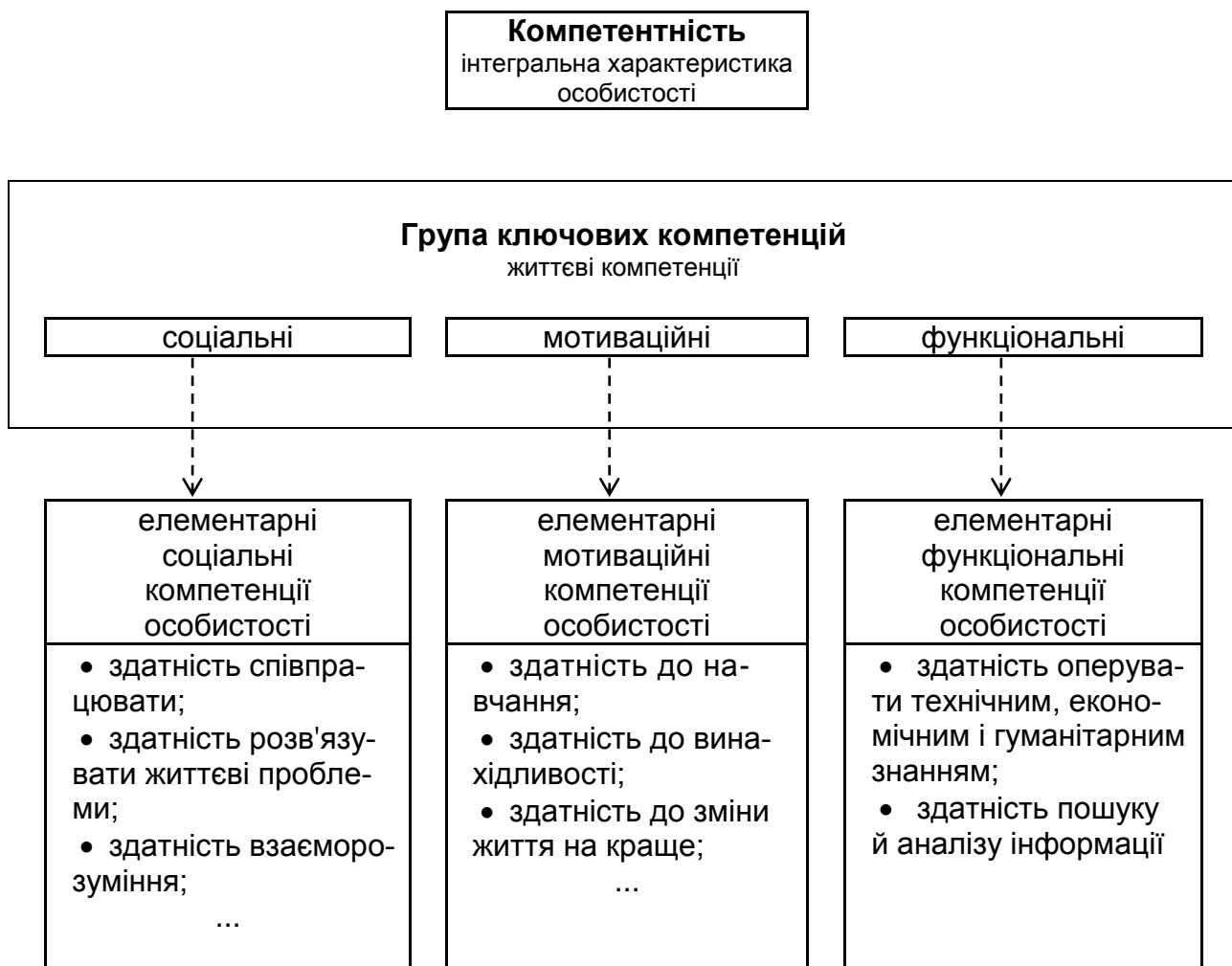
Рис. Г.1. Склад життєвої компетентності

Банківський службовець будь-якої ланки має знати, як функціонує банк. А це передбачає розуміння процесу переміщення ресурсів, побудови системи фінансових послуг з метою сконцентрувати її на інтересах клієнта; роботу з кредитами, визначення оцінки бізнес-планів і діяльності підприємств; вирішення, куди слід вкладати гроші; прогнозування прибутків; здійснення маркетингової діяльності – розроблення і прогнозування фінансових послуг.