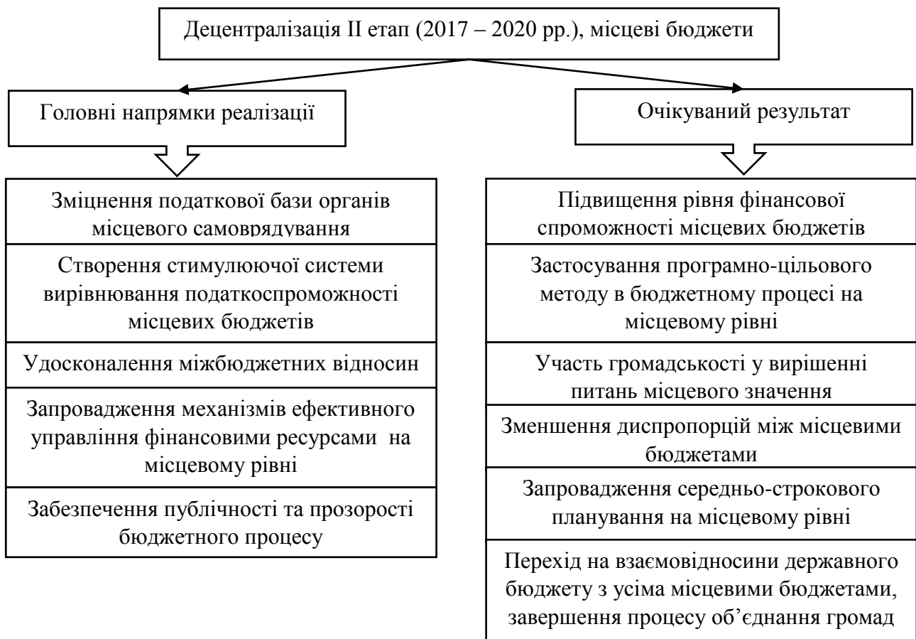
Рис. 2. Децентралізація II етап (2017 – 2020 рр.), місцеві бюджети

Таким чином, ми бачимо, що у процесі проведення реформи децентралізації управління та територіальної організації закладено в механізмі управління місцевими бюджетами стимулюючої системи громад до об'єднання, ефективного управління фінансовими ресурсами, прозорості та ін. Об'єднані відповідно до Бюджетного кодексу громади одержали дохідну базу та видаткові повноваження як міста обласного значення.