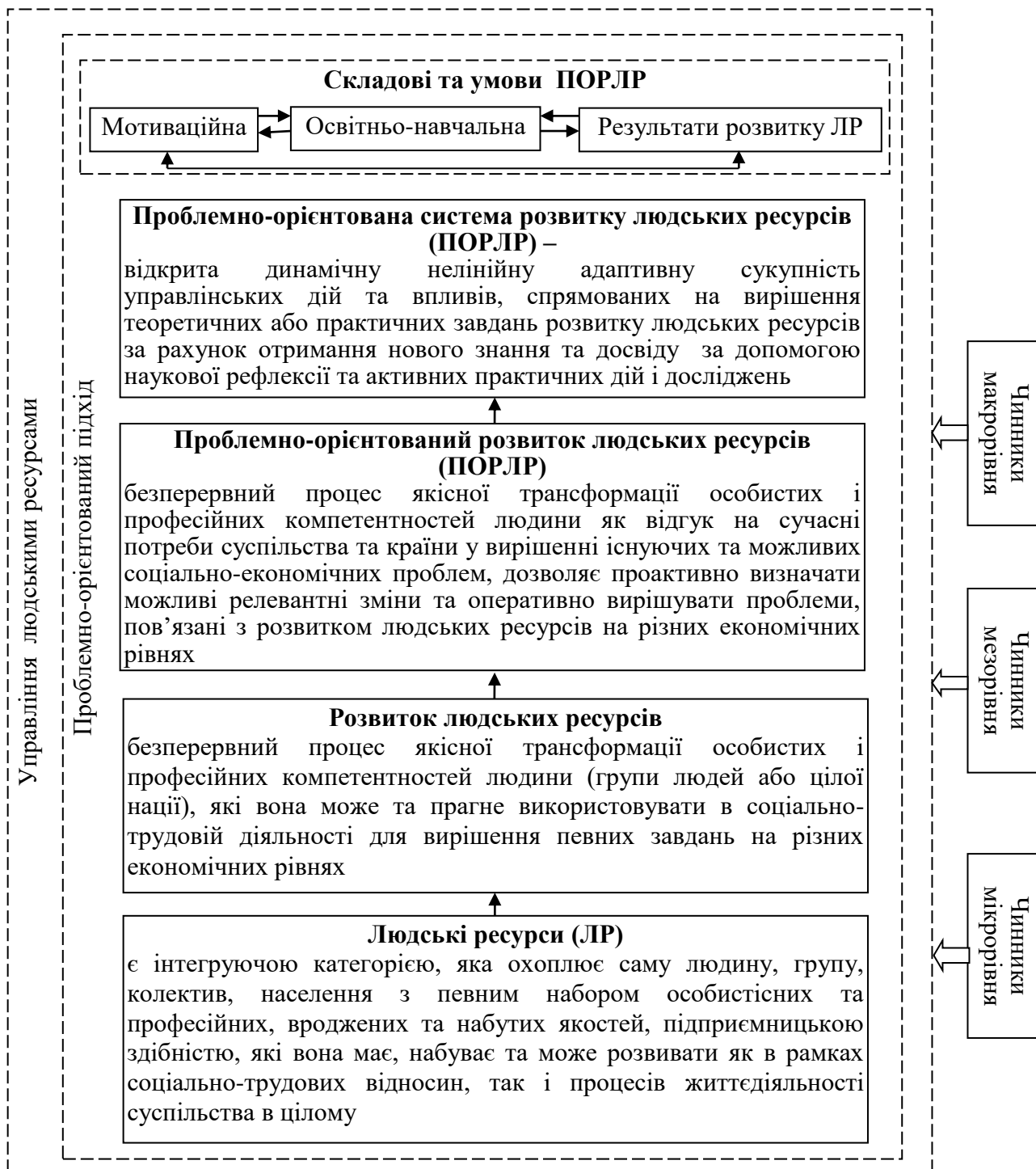
Рис. 2. Взаємозв'язок категорій теорії проблемно-орієнтованого розвитку людських ресурсів

«проблемно-орієнтований розвиток людських ресурсів», «Проблемно-орієнтована система розвитку людських ресурсів» (рис. 2) [1-4].