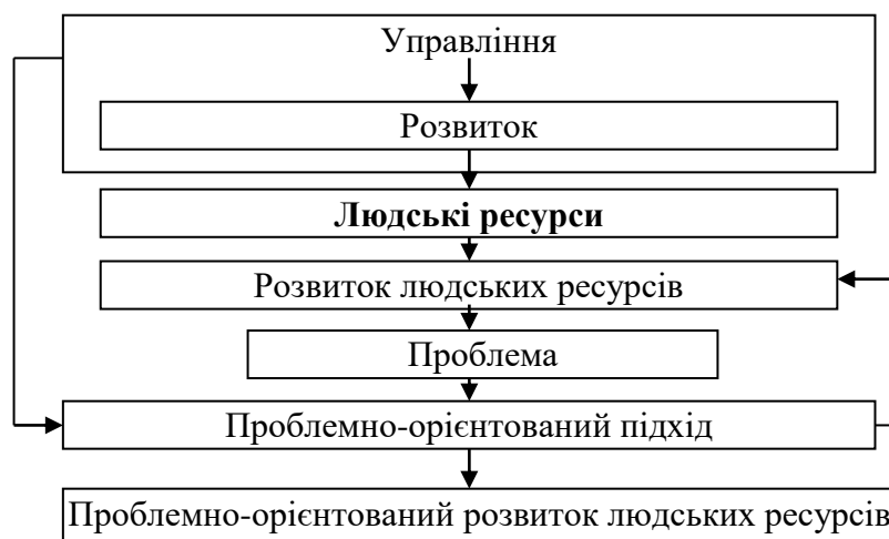
Рис. 1. Взаємозв'язок основних категорій розвитку людських ресурсів

Місце розвитку людських ресурсів в управлінні з урахування проблемно-орієнтованого підходу наведено на рис. 1.