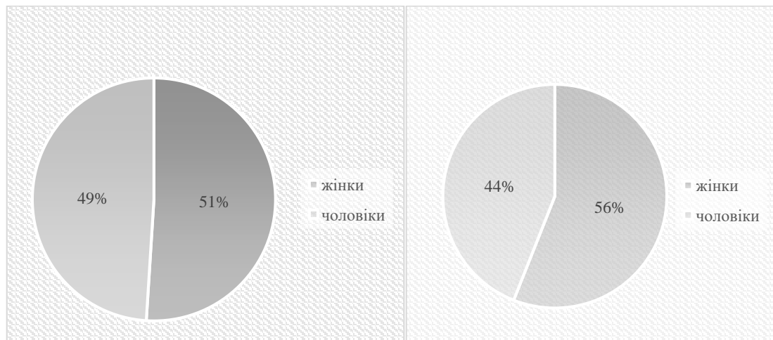
Рис. 2 Особи, які отримали статус безробітних у березні-квітні 2019 року

На рис. 2 та рис. 3 розглянемо порівняльну характеристику гендерного впливу пандемії та карантинних заходів на рівень безробіття [4].