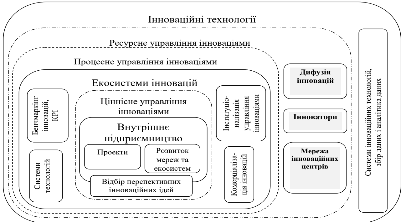
Рис. 2- Концептуальне забезпечення дифузій інновацій на макро та мікро рівнях

підприємницькі поведінкові характеристики (проактивність, інноваційність та схильність до ризику) менеджменту; здатність синтезувати і застосовувати поточні та набуті знання в пошуках бізнес-можливостей; здатність створювати, розширювати та модифікувати ресурси; вміння генерувати нові знання на основі поєднання власного досвіду та зовнішніх джерел, включаючи комунікації зі стейкхолдерами.