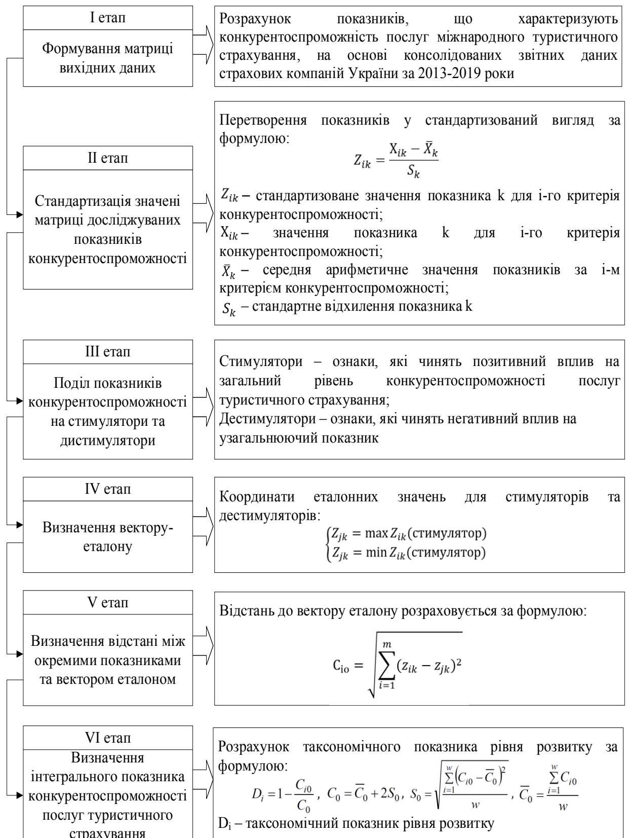
Рис. 1. Порядок визначення інтегрального показника конкурентоспроможності послуг міжнародного туристичного страхування

ризиків, що покриваються договором, свідчить про привабливість та конкурентоспроможність послуг міжнародного туристичного страхування, що надають вітчизняні страховики.