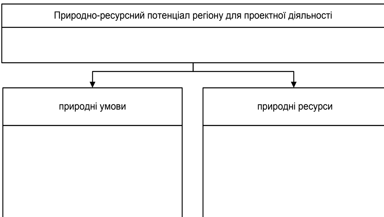
Рис. 4.1. Визначення і склад природно-ресурсного потенціалу регіону в умовах здійснення проектної діяльності

Заповніть порожні блоки, що наведені на схемі (рис. 4.1), визначеннями і складовими елементами природно-ресурсного потенціалу регіону в умовах здійснення проектної діяльності.