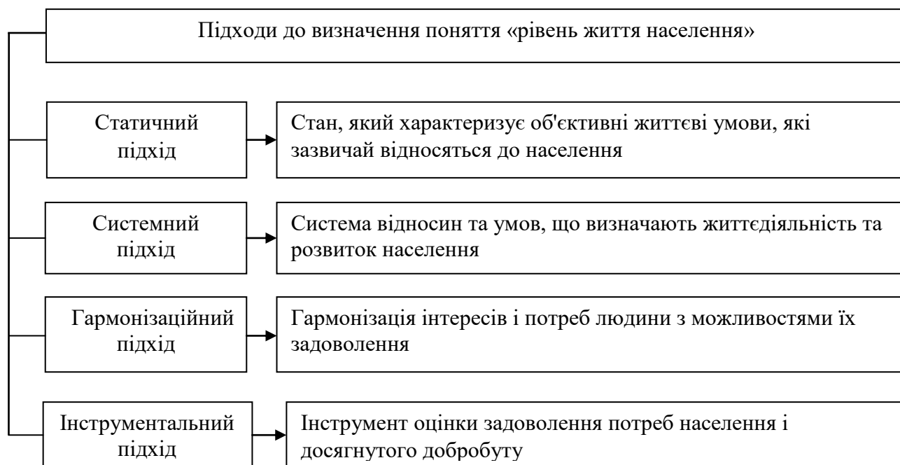
Рис. 2. Підходи до визначення поняття «рівень життя населення»

Узагальнено автором на основі критичного аналізу визначень поняття