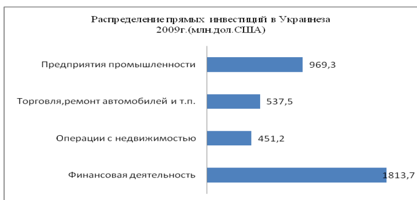
Рис. 2. Распределение прямых инвестиций за 2009 год

автомобилей, бытовых изделий, предметов личного потребления – на 537,6 млн долл., а также на предприятиях промышленности – на 969,3 млн долл., в том числе перерабатывающей – на 885,1 млн долл. (рис. 2).