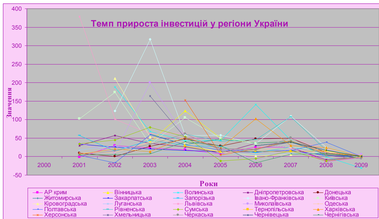
Графік 2. Темп приросту інвестицій у регіони

Привабливість регіонів країни має тенденцію змінюватися кожного року. На це впливають різні чинники, в останній час – це світова фінансова криза. Розглянемо на графіку 2 такий аналітичний показник динаміки, як темп приросту інвестиційних надходжень у регіони України.