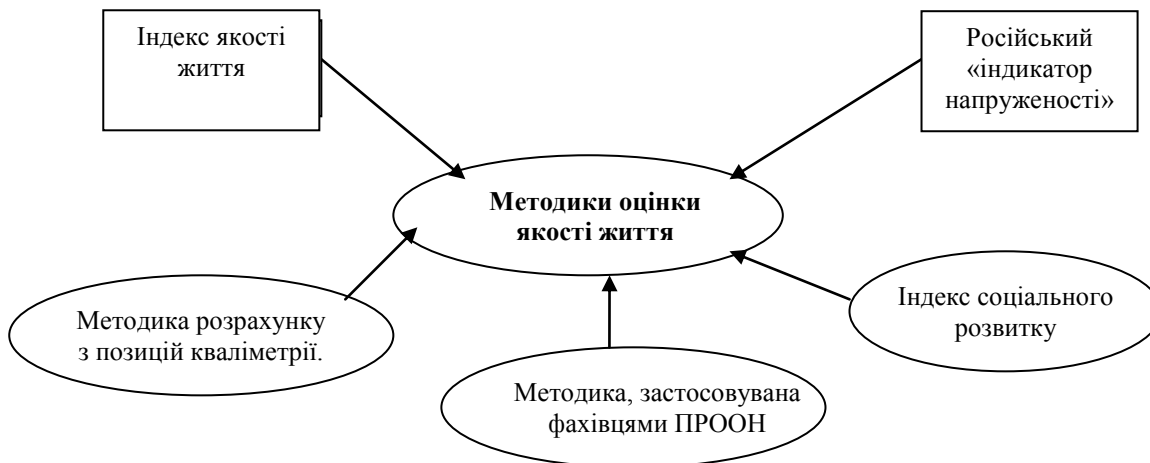
Рис. 3. Методики оцінки якості життя населення

Що стосується методів оцінки якості життя населення, виходячи зі складності досліджуваного об'єкта, великої кількості аналізованих показників, їхньої типової неоднорідності можна стверджувати, що тут необхідно використовувати не один, а цілий комплекс методів дослідження: статистичних, соціологічних, економіко-математичних тощо. На сьогоднішній час існує багато національних та світових методик, що дозволяють проводити дослідження якості життя населення з системних позицій. На рис. 3 наведені найбільш розповсюдженні методики.