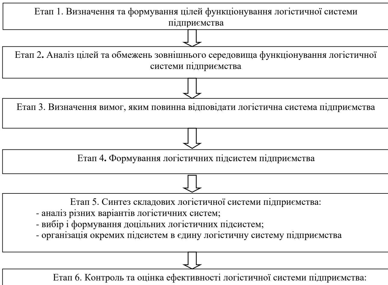
Рис. 1. Етапи формування логістичної системи підприємства на основі системного підходу.

На шостому, останньому, етапі здійснюється контроль та оцінка ефективності функціонування логістичної системи, результати якої є основою для її зміни.