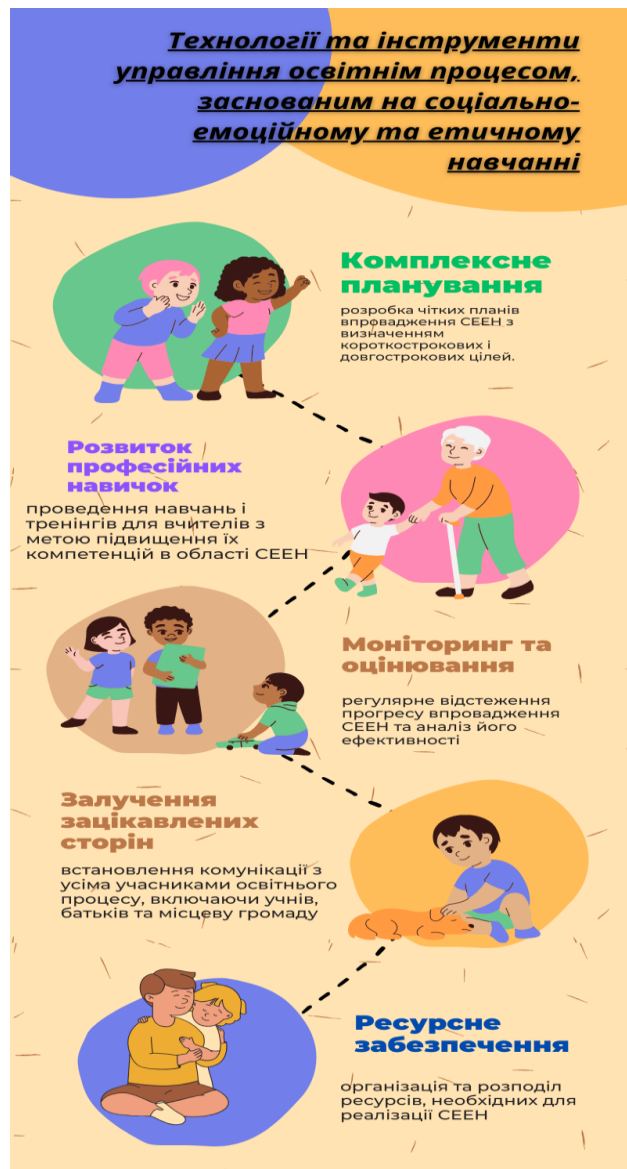
Рис. 2.4. Технології та інструменти управління освітнім процесом, заснованим на соціально-емоційному та етичному навчанні

Для візуалізації інструментів та технологій наочно можна представити наступну інфографіку зазначеного інструментарія: