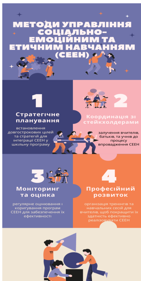
Рис. 2.2. Методи управління соціально-емоційним та етичним навчанням (СЕЕН)

Четвертий метод, моніторинг та оцінювання, передбачає регулярне відстеження ходу впровадження програми та аналіз її результативності. Це включає оцінку ефективності різних компонентів програми, зворотний зв'язок від учасників навчального процесу, а також коригування програми з метою її оптимізації.