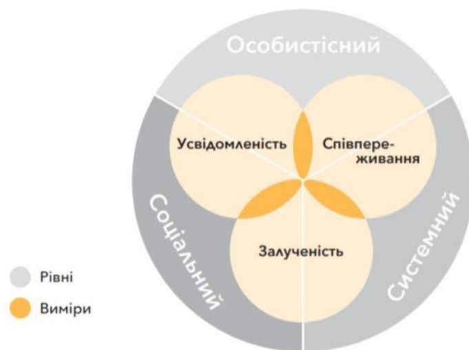
Рисунок 1: Рівні та виміри СЕЕН

Рис. 2.3. Модель чотирьох компонентів особистісного розвитку: особистісні, соціальні, співпереживання та задоволеність, в контексті соціально-емоційного навчання.