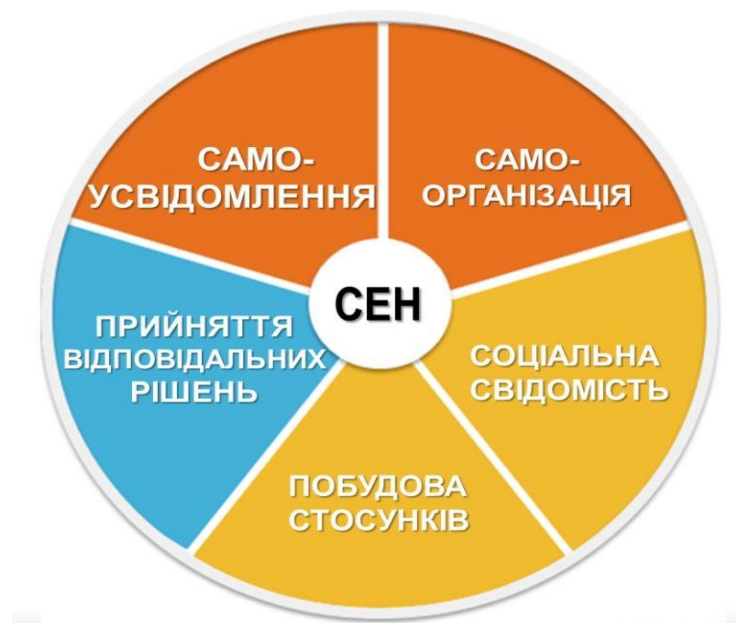
Рис. 1.3. Компоненти соціально-емоційного навчання (СЕН): самоусвідомлення, самоорганізація, соціальна свідомість, побудова стосунків та прийняття відповідальних рішень.

Для впровадження соціально-емоційного виховання в установах загальної середньої освіти необхідно створити оптимальні умови навчально-виховного супроводу, що дозволяють максимально підвищити здатність учнів засвоювати навчальний матеріал, а також формувати соціальні та емоційні навички.