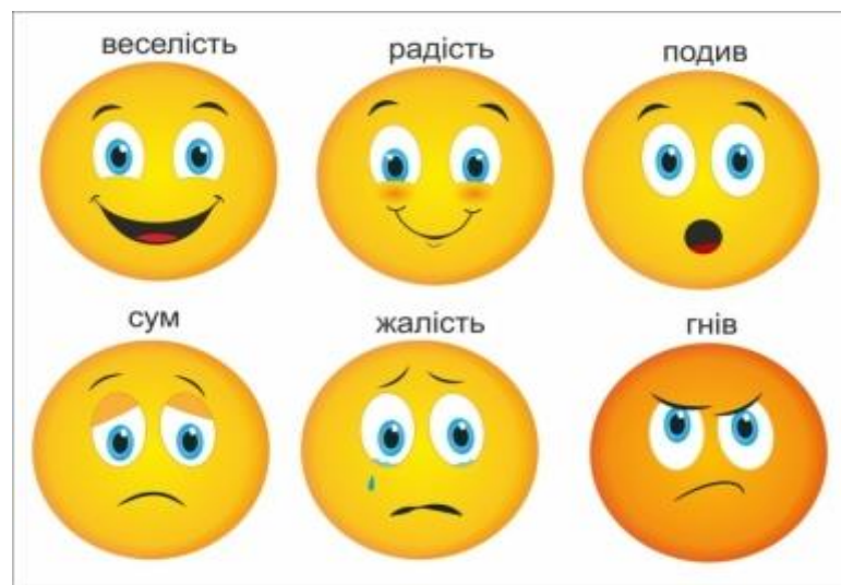
Рис. 1.1. Ілюстрація емоційних символів (емодзі) для визначення спектру базових емоцій: веселість, радість, подив, сум, жаль, гнів.

Ця концепція заснована на науково обґрунтованих результатах роботи СЕН – соціально-емоційного навчання, і відображає модель, запропоновану авторами Д. Гоулманом та П. Сенгом у книзі «Потрійний фокус» : увага до себе, увага до інших та увага до взаємозалежностей та систем [8,с.15].