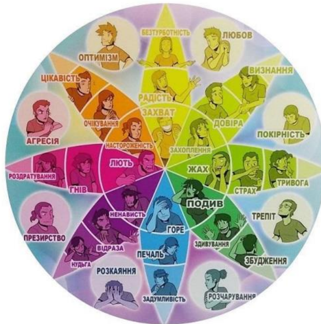
Рис. 2.1. Схема емоційного колеса, що класифікує та ілюструє широкий спектр людських емоцій (радість, гнів, смуток, страх, вдячність, захоплення тощо)

організацію шкільних структур, учні помітять цю невідповідність. Це може ускладнити сприйняття та засвоєння учням навчального матеріалу.