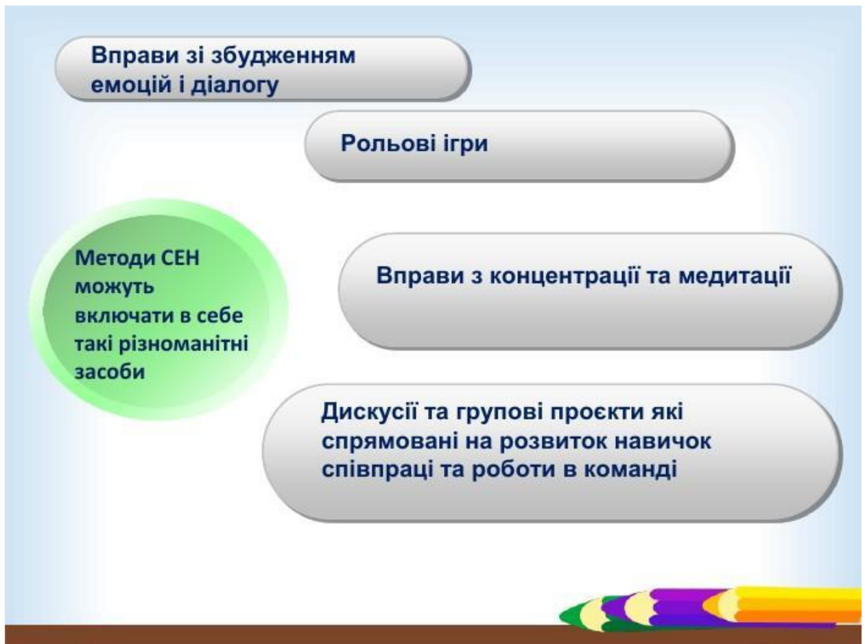
Рис. 1.2. Візуалізація компонентів соціально-емоційного навчання (СЕН), включаючи вправи для розвитку емоцій, рольові ігри, методи концентрації та медитації, а також дискусії та групові проекти для розвитку навичок співпраці та роботи в команді.

Програма СЕЕН включає в себе спеціальні уроки, які адаптовані для різних вікових груп учнів, але мають єдину структуру та зміст. Кожне заняття триває від 20 до 40 хвилин і складається з п'яти основних частин: розминка, презентація, обговорення, вправи на розуміння та рефлексивна практика. Це дозволяє учням не лише засвоїти новий матеріал, а й глибше рефлексувати над ним.