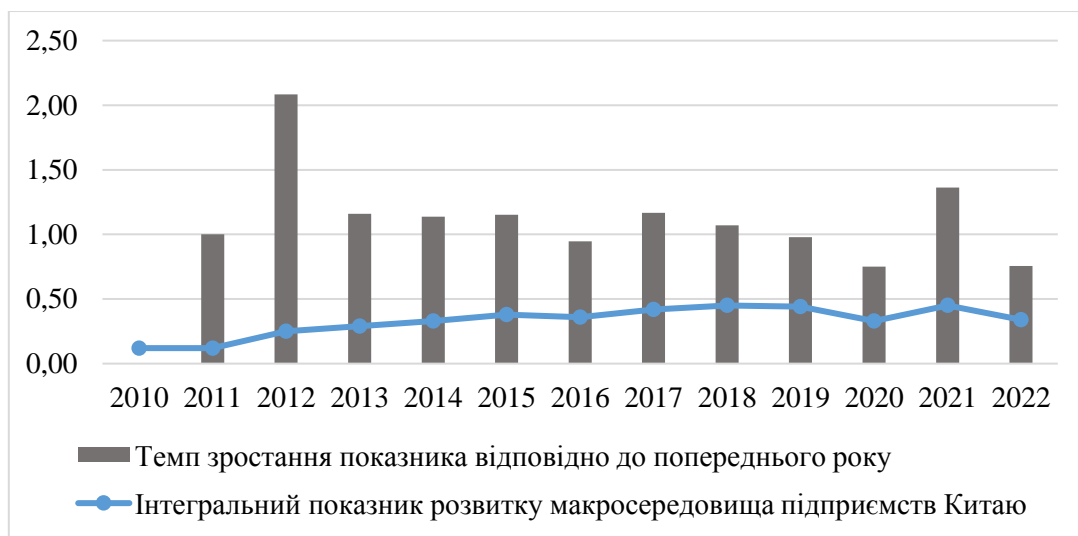
Рис. 3. Динаміка зміни інтегрального показника розвитку загального макроекономічного середовища підприємств Китаю

Дані представлені на рис. 2 свідчать про те, що до 2015 року підприємства України мали нестабільний динаміку розвитку загального макроекономічного середовища, що здійснювало вплив на їх діяльність. Політична ситуація (революція Гідності 2013 р. та вторгнення росії до Луганської та Донецької областей 2014 р.) спричинила зниження рівня загального макроекономічного розвитку України. Починаючи з 2016 року в країні розпочався процес відновлення економічного розвитку, який у 2022 р. був зламаний воєнною агресією росії проти України. Зрозуміло, що національні підприємства мали адаптуватися до таких флуктуацій відповідно до своїх ресурсних обмежень.