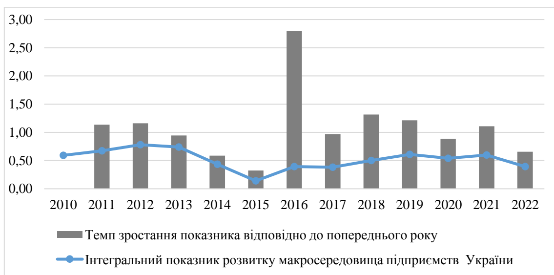
Рис. 2. Динаміка зміни інтегрального показника розвитку загального макроекономічного середовища підприємств України

Етап 3. Аналіз тенденцій рівня розвитку загального макросередовища підприємств. Використовуючи динамічний та графічний аналіз, проведено аналіз ретроспективних трендів зміни інтегрального показника для України (рис. 2). та Китаю (рис. 3).