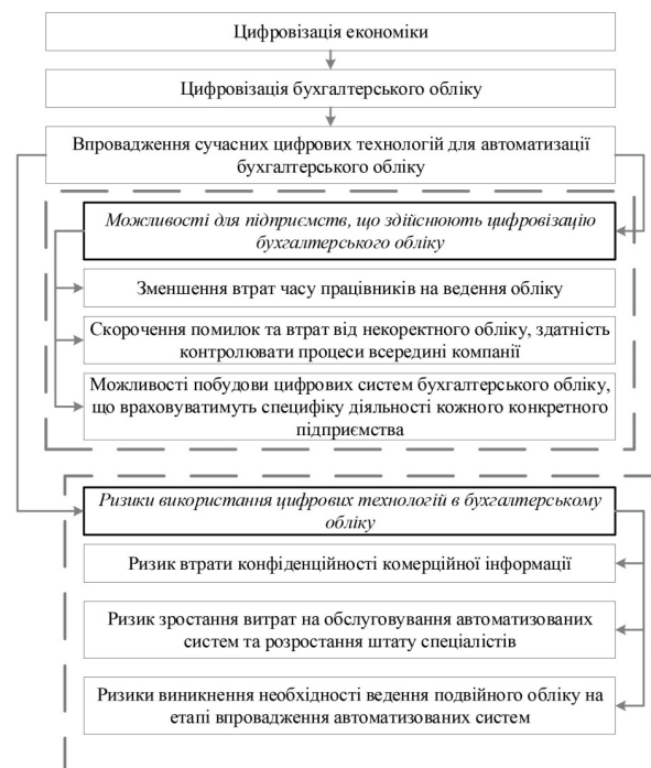
Рис. 2. Можливості та ризики, що створює для підприємства автоматизація та цифровізація бухгалтерського обліку (власна розробка авторів)

Завдяки цифровізації бухгалтерського обліку керівництву організації буде доступно наочні матеріали про діяльність підприємства, графіки, аналітичні документи, які проілюструють реальний результат роботи компанії у різних звітних періодах. Для сфери бізнесу стане можливим створення опрацьованих бізнес-моделей, оскільки в наявності будуть дані про поточний стан підприємства та перспективи його розвитку.