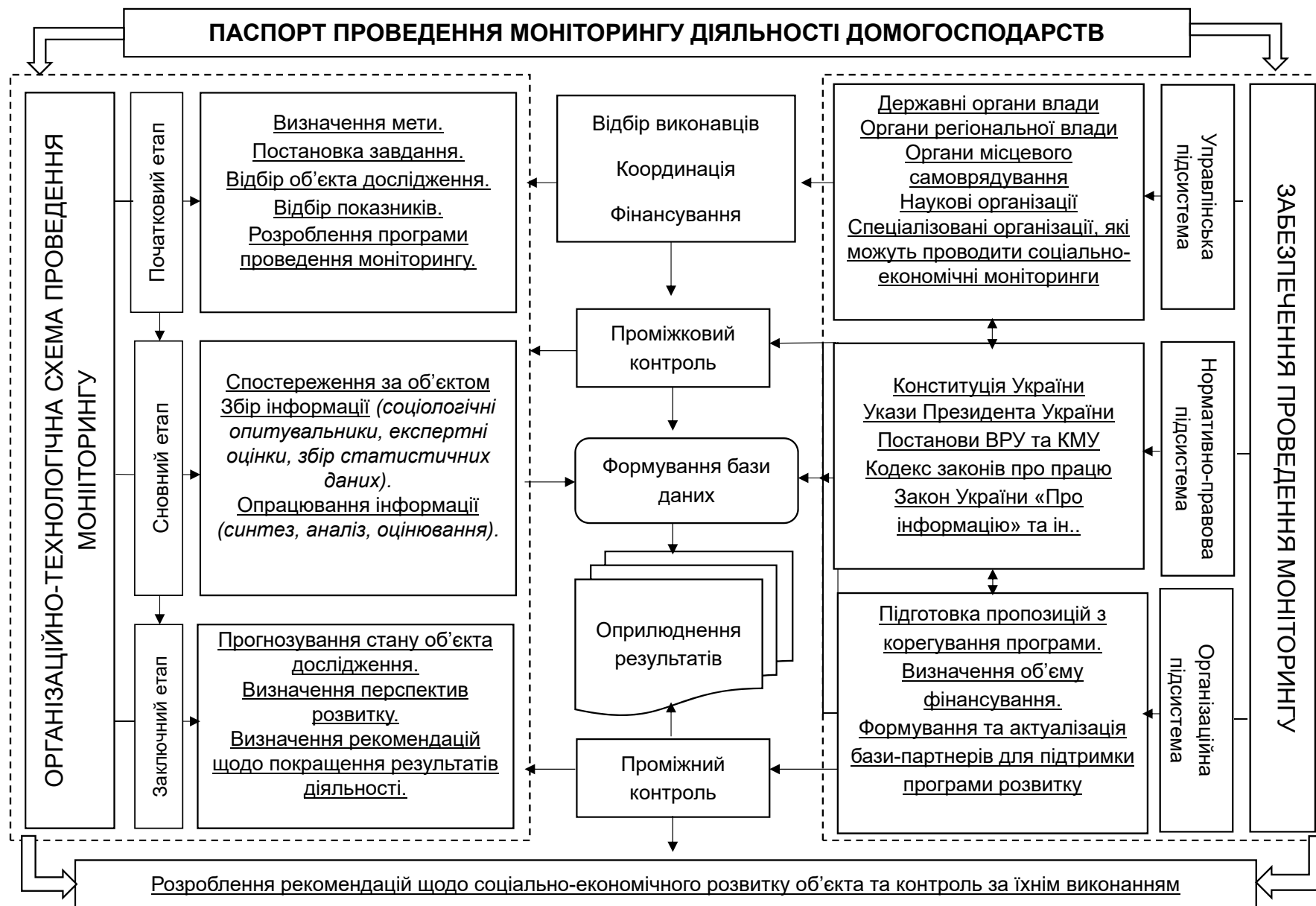
Рисунок 1. Паспорт проведення моніторингу соціально-економічної діяльності домогосподарств