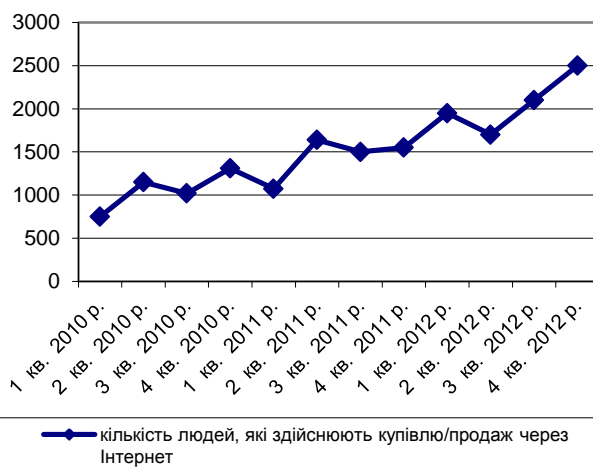
Рис. 2. Кількість людей в Україні, які здійснювали купівлю чи продаж через Інтернет за 2010 – 2012 рр. [9; 10]

Таким чином, у сучасному ринковому середовищі, в умовах широкого вибору та диференціації товарів, конкурувати підприємствам без сильної торгової марки, яка могла б забезпечити унікальність, неповторність та диференціацію пропозиції, практично неможливо. Необхідно створювати умови, за яких продукт компанії зможе втілювати важливі й цінні для споживача якості, настільки потрібні йому, щоб він, безумовно, вибрав саме цей продукт, символічно одержуючи все те, що має для нього особливе значення [11]. Саме Інтернет-брендинг слугує інструментом реалізації таких умов.