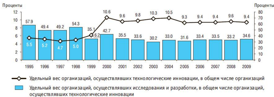
Рис. 1. Динамика уровня инновационной активности организаций промышленного производства [1]

Российская экономика на современном этапе характеризуется достаточно низкой степенью инновационной активности (рис. 1), и для ее конкурентоспособности это является однозначно неблагоприятным фактором. Для оздоровления экономики России и ее устойчивого развития необходимо успешно реализовать инновационный потенциал страны.