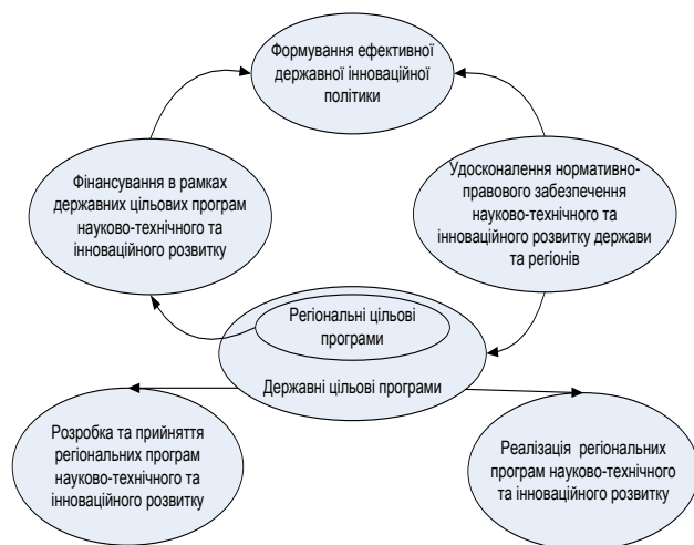
Рис. Механізм реалізації стратегії інноваційного розвитку регіонів

На четвертому етапі розробляється механізм реалізації стратегії інноваційного розвитку регіонів (рисунок).