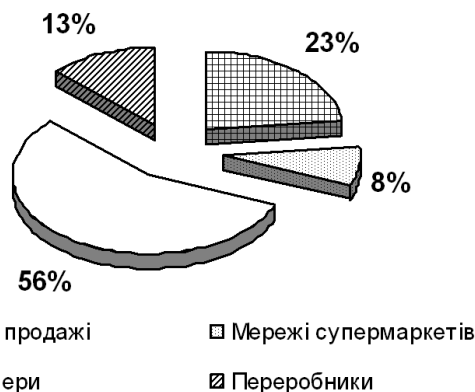
Рис. 1. Портфель реалізації ЗАТ Агрофірма "Авіс" (9 місяців 2010 р., дані спостереження)

За результатами аналізу динаміки надходжень протягом трьох кварталів 2010 року можна зробити висновок, що портфель реалізації підприємства характеризується структурою, наведеною на рис. 1.