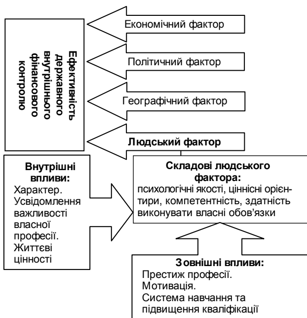
Рис. 1. Людський фактор у забезпеченні ефективності державного внутрішнього фінансового контролю (авторське бачення)

Проведене дослідження дозволило наочно представити авторське бачення людського фактора в забезпеченні ефективності державного внутрішнього фінансового контролю (рис. 1).