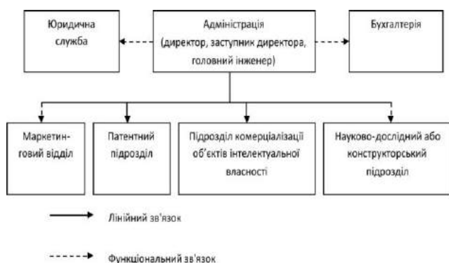
Рис. 2. Організаційна структура управління об'єктами промислової власності

Ураховуючи особливості створення та використання об'єктів промислової власності на підприємстві, організаційну структуру управління ними можна подати таким чином (рис. 2).