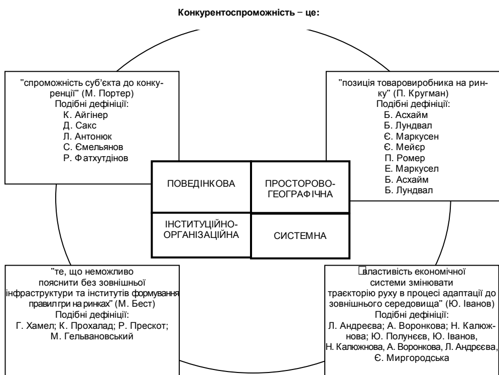
Рис. Матриця парадигм конкурентоспроможності

чує підвищення рівня концептуалізації, а навпаки – посилює фрагментацію знання у дисциплінарних відсіках, у кожному з яких пропонується своє бачення теоретичних основ конкурентоспроможності. І хоча все більш активізується перехід від спрощених тавтологічних до більш досконалих міждисциплінарних дефініцій, проблема теоретичних основ конкурентоспроможності дотепер залишається предметом багатодисциплінарного, а не між- або наддисциплінарного знання. Загальний стан розробки теоретичних основ конкурентоспроможності сьогодні визначається сукупністю дисциплінарних бачень, які у формі матриці парадигм конкурентоспроможності наведені на рисунку.