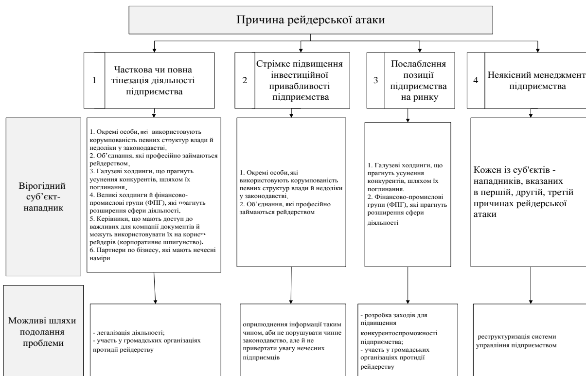
Рис. 2. Заходи, що сприятимуть зменшенню вірогідності рейдерських посягань