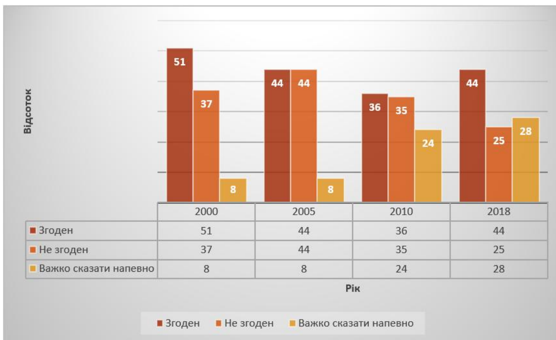
Рис. 1. На скільки підтримка кар'єри чоловіка важливіша за власну, 2000-2018, % [1]

Як показали результати опитування у 2000 р., 51% опитаних повністю згодні з твердженням, 37% - цілкоміто та в основному не згодні, 8% - не надали однозначної відповіді. Вже у 2018 р. зацікавленість гендерними аспектами кар'єри повернулася, частка згодних з необхідністю підтримки чоловічої кар'єри повернулася до значення 2005 р. і склала 44% [1].