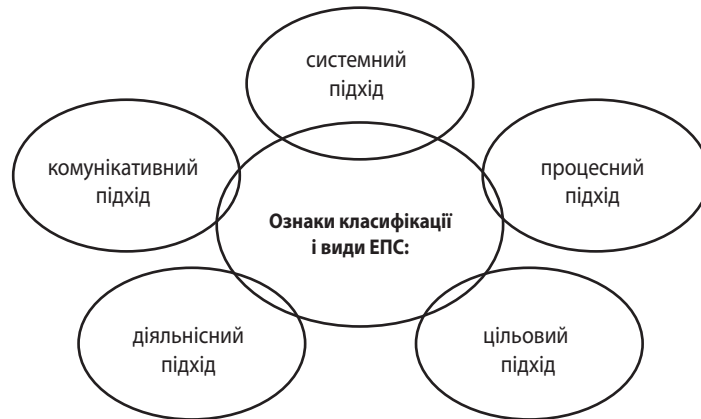
Рис. 1. Ключові підходи до розуміння змісту поняття «міжнародна діяльність ЗВО»