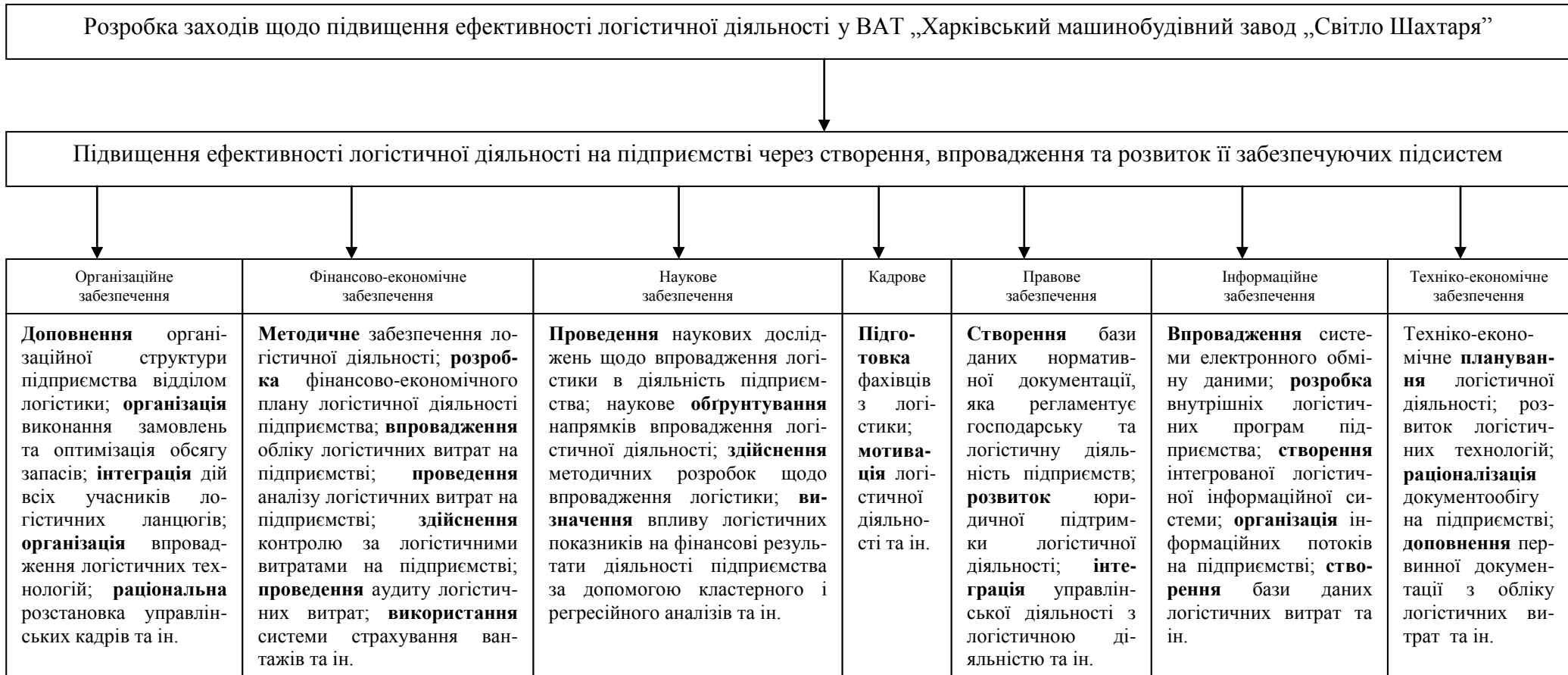
Рис. 1. Заходи щодо підвищення ефективності логістичної діяльності у ВАТ „Харківський машинобудівний завод „Світло Шахтаря”