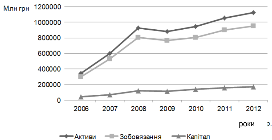
Рис. 2. Динаміка показників діяльності банківської системи України

Діагностику рівня капіталізації банківської установи доцільно проводити за такими основними напрямками: визначення основних показників, які впливають на рівень капіталізації банківської установи; аналіз рівня достатності капіталу; ефективність використання ресурсів.